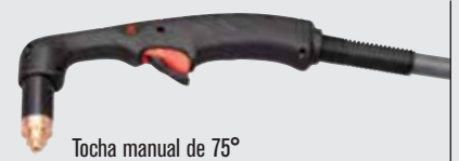
Tocha manual de 75°

(para mais opções de tochas, visite www.hypertherm.com )