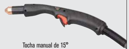
Tocha manual de 15°