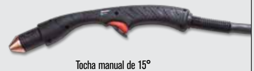
Tocha manual de 15°