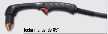
Tocha manual de 85°

Estilos de tocha padrão Duramax (para mais opções de tochas, visite www.hypertherm.com )