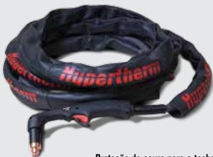
Proteção de couro para a tocha