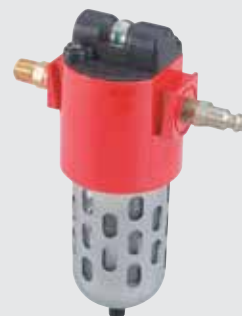
Conjunto de filtragem de ar