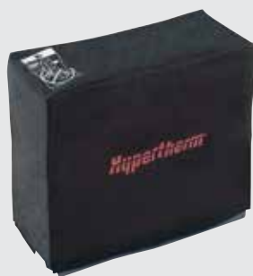
Capa para proteção do sistema contra poeira