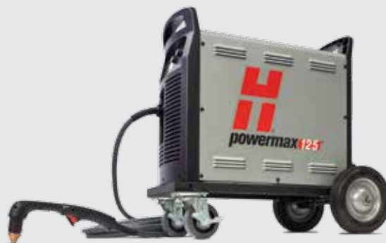
Conjunto de rodas